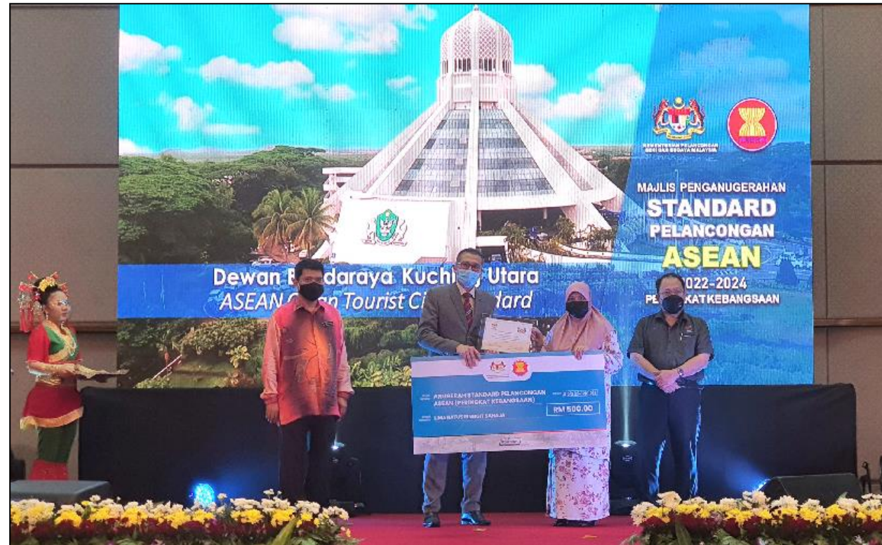
ANUGERAH ASEAN CLEAN TOURIST CITY STANDARD (2022 - 2024) PERINGKAT KEBANGSAAN dari Kementerian Pelancongan, Seni dan Budaya (MOTAC), Malaysia pada 7 Mac 2022 di Double Tree By Hilton Hotel, Kuala Lumpur